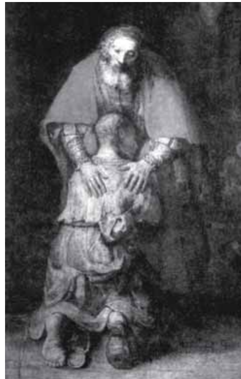
Худ. Рембрандт ван Рейн. Повернення блудного сина (1669 р.)

мусимо усвідомлювати, що священик не сповідає каяника, а сам каяник повинен сповідатися, пам'ятаючи, що у св. Тайні Священства є присутній Сам Христос, і саме Він слухає нашої сповіді в ушах